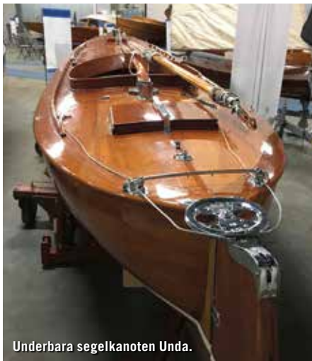
Underbara segelkanoten Unda.