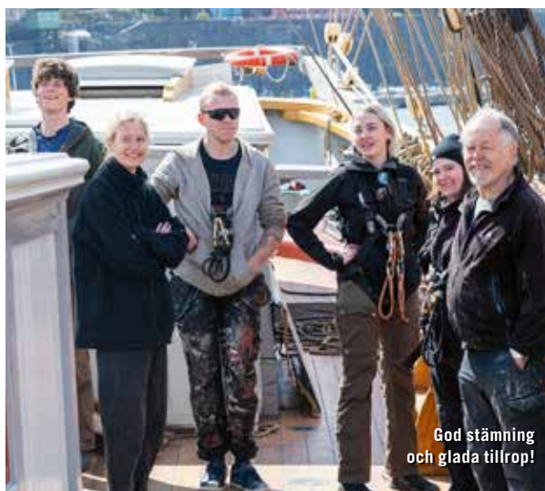
God stämning och glada tillrop!