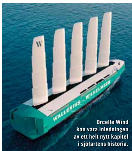
Orcelle Wind kan vara inledningen av ett helt nytt kapitel i sjöfartens historia.