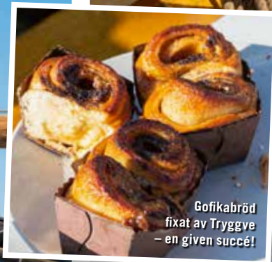
Gofikabröd fixat av Trygve – en given succé!