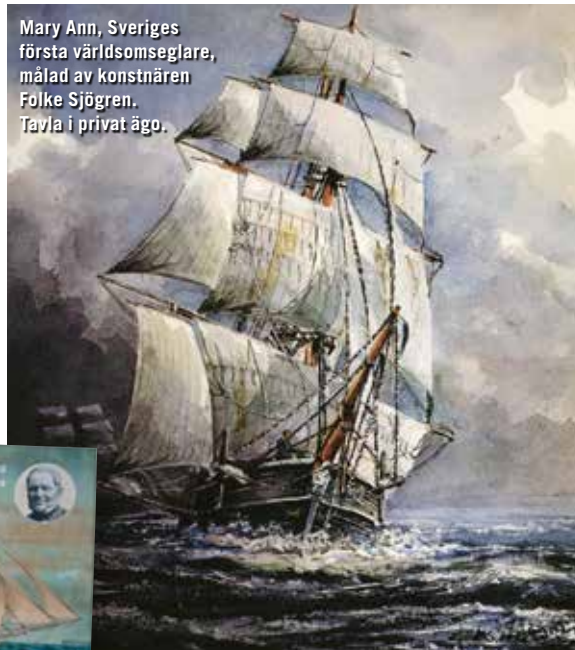
Mary Ann, Sveriges första världsomseglare, målad av konstnären Folke Sjögren. Tavla i privat ägo.

så litet jämfört med andra skeppen. När de sedan skulle signalera till hamnen att Mary Ann på väg in, saknades signal för "svensk". Hon blev i stället registrerad som ett skepp från "okänd nation".