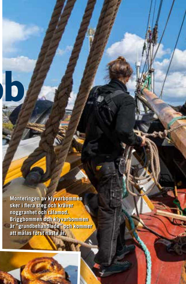
Monteringen av klyvarbommen sker i flera steg och kräver noggrannhet och tålmod. Briggbommen och klyvarbommen är "grundbehandlade" och kommer att målas först nästa år.