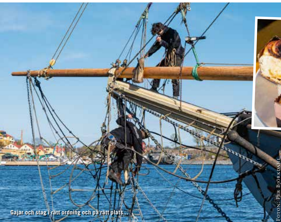
Gajar och stag i rätt ordning och på rätt plats...