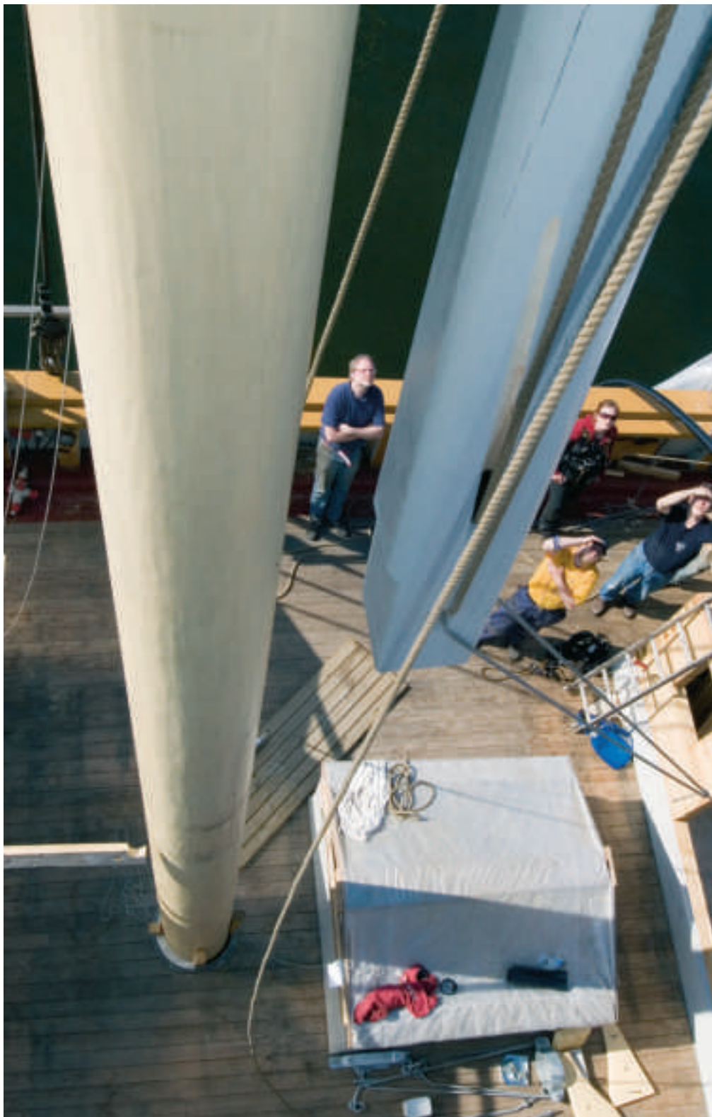
Mycket finlir krävde stort tålamod. Här är stormärsstången halvvägs upp.