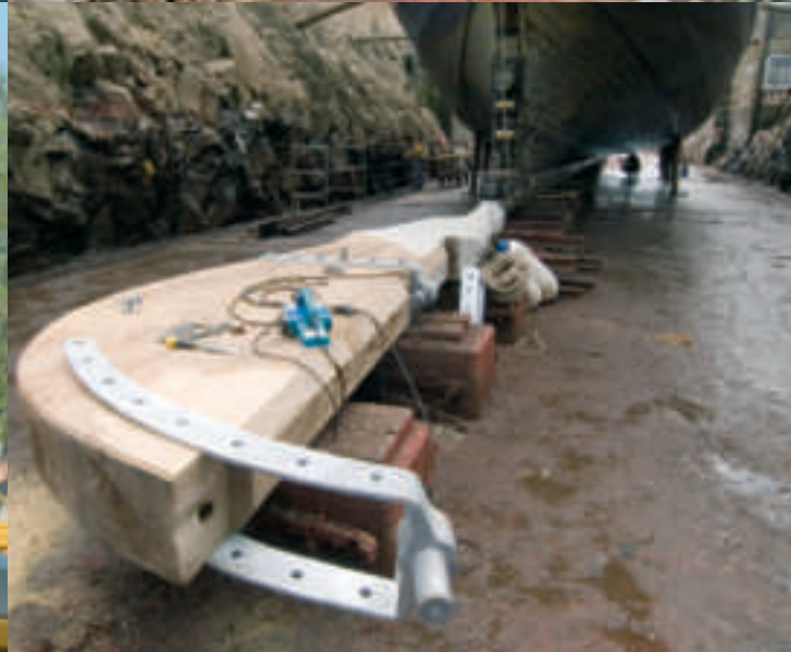
Under den dryga veckan på Beckholmen kunde ett stort antal besökare njuta av bela det vackra skrovet. Det ett ton tunga rodet bogserades till Beckholmen före dockningen. Alla beslag finjusterades med nära nog millimeterpassning före slutmontering.

förväntningarna. Det märks att hon är ett stort träskopp, menar Korhan.