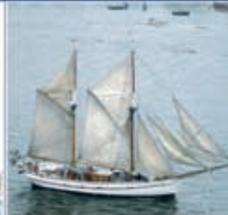
Ruth , Charterssegelfartyg byggd 1914 i RÅÅ. 19,93 x 5,91 x 2,72 m. BMC Sea Lord 98 hk. Pris: 1 600 000 SEK.