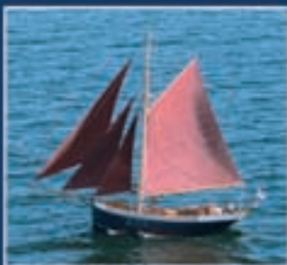
Ingrid , Nybyggd, 21,7 x 4,2 x 2,2 m. Byggt 1894. Segelfartyg byggd 1905, omfattande för långlandssegelster. Pris: 790 000 EURO.