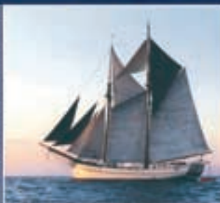
Hulda , Segelfartyg byggd 1905, omfattande ombyggnationen. Bostadsred.