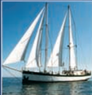
Jaqueline , Charterssegelfartyg byggd 1894. 19,35 x 4,76 x 2,20 m. 4 dubbel + 1 trippelhytt. Pris: 1 500 000 SEK.