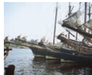
Överst: Deltagarna i regattan på väg ut mot start. Åländska "Linden" som vann sin klass, närmast. T.v: Holländska briggen "Astrid". Ovan: Skutorna låg i fyra fem led längs kajerna.