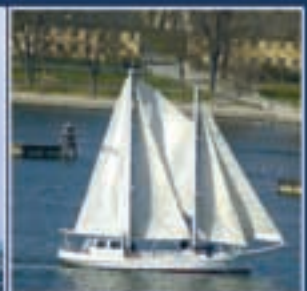
Fria Paulina , Byggt 1900, jernskrov. 18 x 4,43 x 1,7 m. Pris: 1 500 000 SEK.