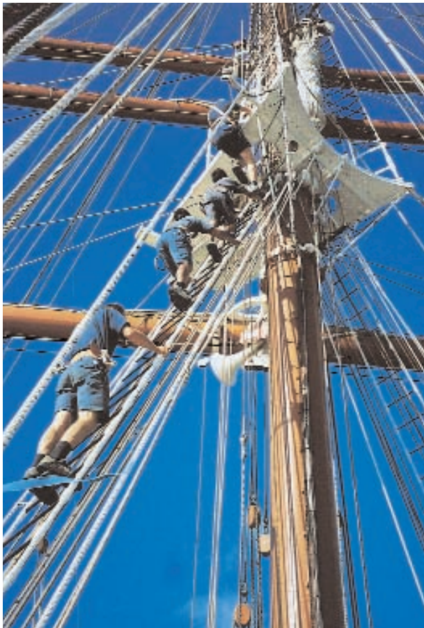
Tycker du att det här ser kul ut? Då kanske du är en av Briggens blivande gästar.