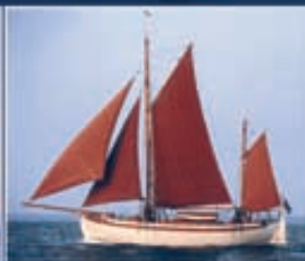
Afthild , Segelfartyg byggd 2000. Skrov i glasfiber. 13,88 x 5,73 meter. Pris: 1 500 000 SEK.