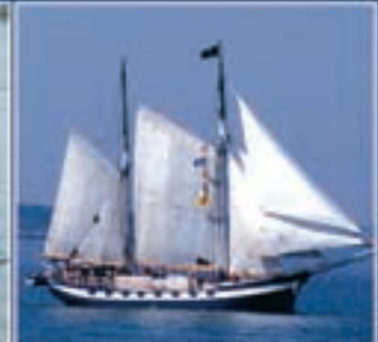
Baltic Beauty , Charterssegelfartyg byggd 1926 i Holland. 40 x 5 x 2,5 m. Skötskrov. Pris: 3 500 000 SEK.

Besök vår hemsida för en komplett lista över segelfartyg till salu.