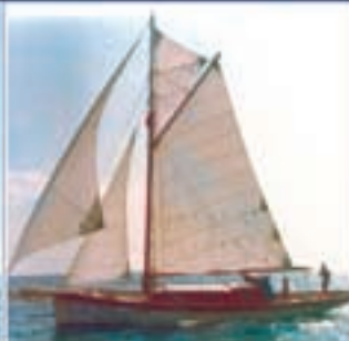
Naim , 12,02 x 3,35 x 1,67 meter. Byggt 1950 i Egypten. Renoverad 1974/1989.