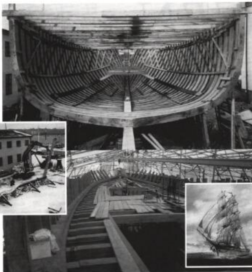
Stockholmsbriggen 1997 till 2002 fotograferad av Christopher Binz, Rolf Sandström och Sture Haglund. Akvarell av Björn Senneby.