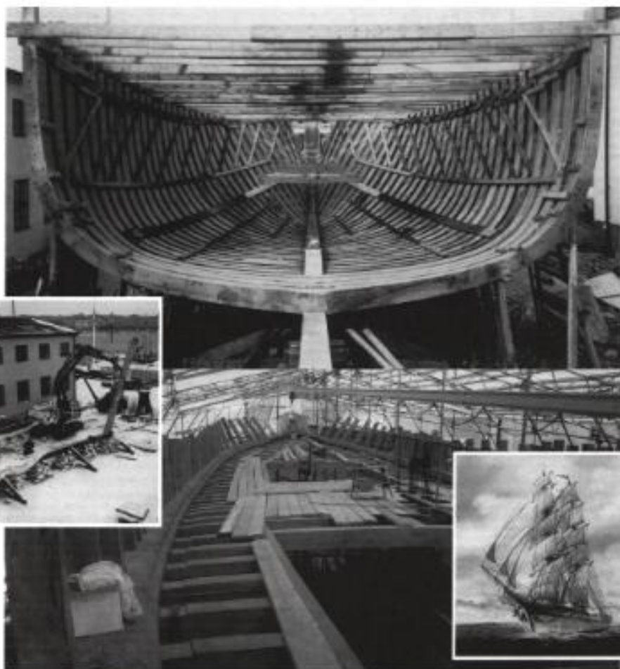
Stockholmsbriggen 1997 till 2002 fotograferad av Christopher Binz, Rolf Sandström och Sture Haglund. Akvarell av Björn Senneby.

SVT:s stora dramatisering under hösten heter "Skeppsholmen" och är inspelad i kvarteren kring Stockholmsbriggen. Den går på torsdagar kl. 20.00 med start den 3 oktober.