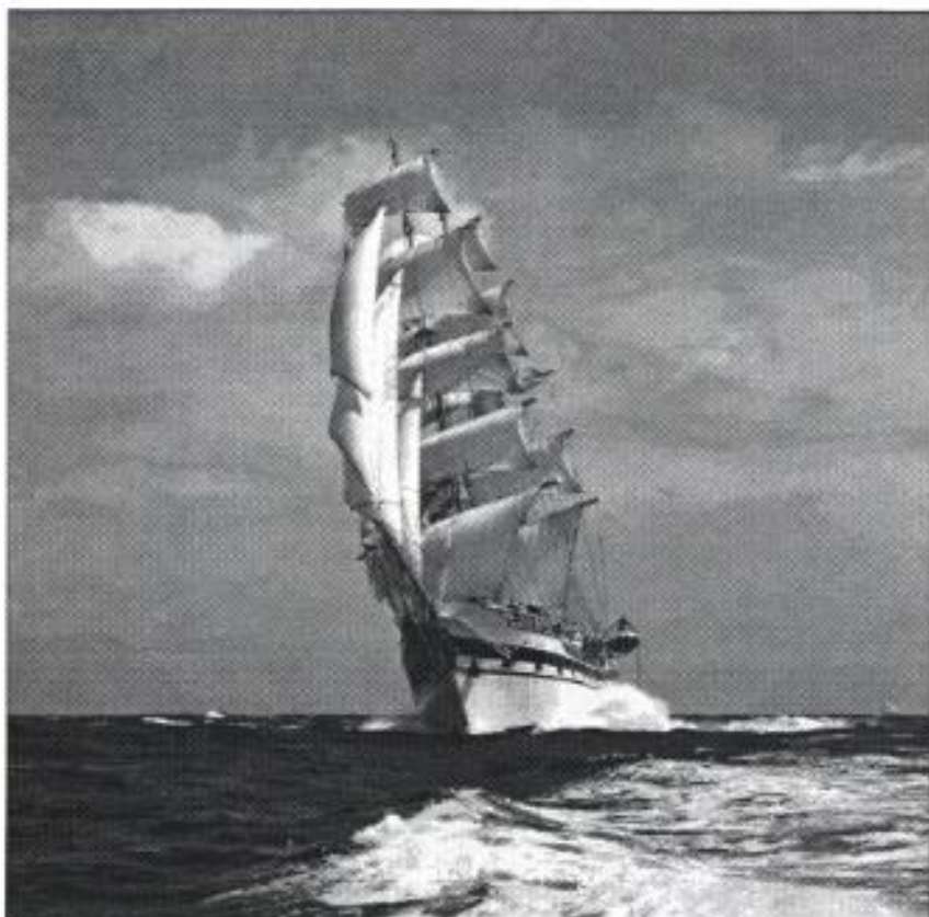
Sjösättning 2003 är ett tufft mål som vi har satt upp. Det kommer att lyckas med din hjälp.