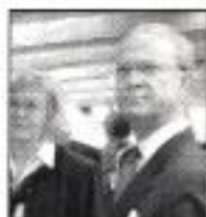
En amiral besiktigar Stockholmsbriggen.

Tidigt på morgonen den 6 maj kom en granne på besök. Kung Carl XVI Gustaf inspekterade Stockholmsbriggen och blev samtidigt ägare till fem kvadratmeter röjel på fockmasten.