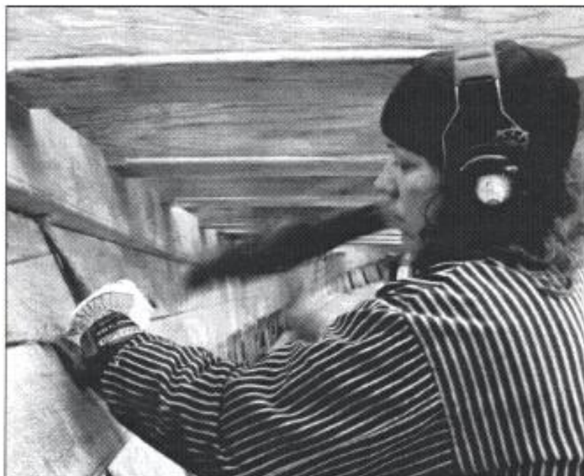
Med drevklubba, drevjärn och lindrev tätar Åsa skrovet.

– Jättekul. Vi är ett himla bra team och alla gillar verkligen att jobba på briggen. Vi är väldigt noggranna, har stor precision och höga krav på oss själva. Alla, både lärlingar och anställda, kan sitt jobb. Fast man lär sig ju hela tiden.