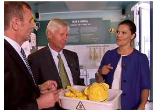
Kronprinsessan Victoria är både påläst och engagerad. Se intervjun på SVT Play.

Från Initiativet Hållbara Hav ser vi fram emot att få samarbeta med Tallink Silja och vi hoppas även kunna bidra till att göra företaget till ett av Östersjöns bästa rederier ur miljösynpunkt. ■ /STURE HAGLUND