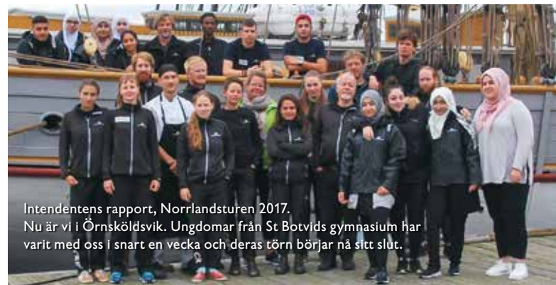
Intendentens rapport, Norrlandsturen 2017. Nu är vi i Örnsköldsvik. Ungdomar från St Botvids gymnasium har varit med oss i snart en vecka och deras törn börjar nå sitt slut.

En viktig del och i arbetet och framgångarna, när det gäller att nå ut till allmänheten, är att ungdomar har en central plats i verksamheten. De kommande åren blir inte något undantag, Briggen initierar under 2018 ett nytt internationellt ungdomsdrivet projekt för Östersjön som fokuserar på de stora problemen som Östersjön står inför.