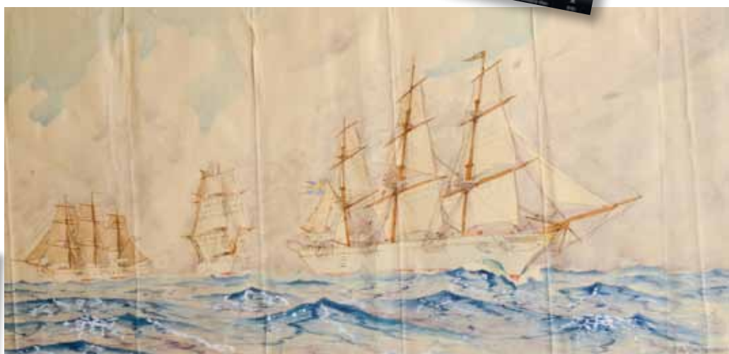
Redaktionen satsar på att akvarellen föreställer fullriggarna Najaden och Jarramas med briggen Gladan i mitten. Gladan hade ursprungligen portmålning men målades 1901 vit. Nedan briggen i närbild.