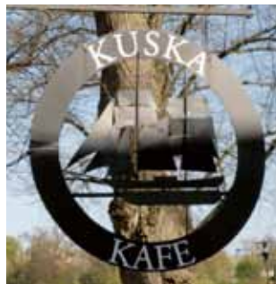
Kuska Kafé, i Utvandrarnas bus, Växjö.

Utvandrarmonumentet drar fortfarande turister till Karlshamn. Det är en sevärdhet i sig och platsen är perfekt vald. Den