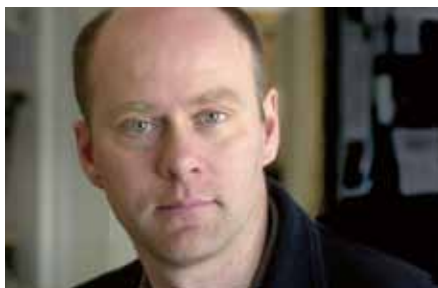
Folke Rydén, känd dokumentärfilmare och före detta korrespondent är en av Hållbara Havs samarbetspartners.

Sedan tidigare har vi avtal med Håll Sverige Rent och Folke Rydén Produktion och för en tid sedan anslöt sig även C2