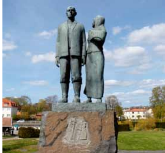
Utvandrarmonumentet i Karlshamn.

Att romanerna om utvandrarna fick ett varmt mottagande och lästes av en stor del av svenska folket är välkänt, men idag har många glömt att de också väckte upprörda känslor. Författaren Ebbe Reuter Dahl och några småländska riksdagsmän, präster och lärare startade upprop för att förbjuda böckerna, som de ansåg gav en nidsbild av smålänningar och dessutom var osedliga.