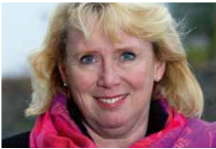
Miljöminister Lena Ek blir inledningstalare på seminariet i Kolskjulet.

I Kalmar, Karlshamn, Helsingborg, Nyköping och Stockholm sätts miljöutställningen "Gifter i havet" upp och i Simrishamn och Stockholm kommer Håll Sverige Rent och