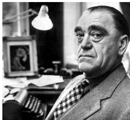
Wilhelm Moberg, 1967.