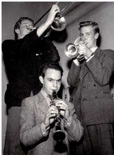
Bunta Horns karriär som jazzmusiker startade redan i tonåren.