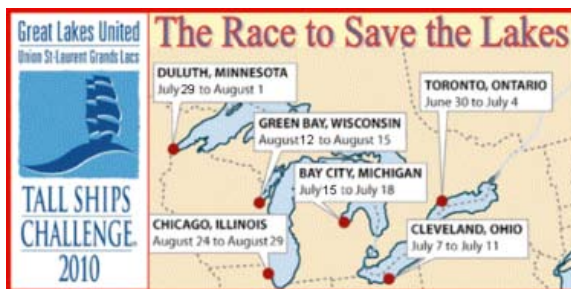
Segling för en ren miljö – ”Great Lakes Challenge 2010”