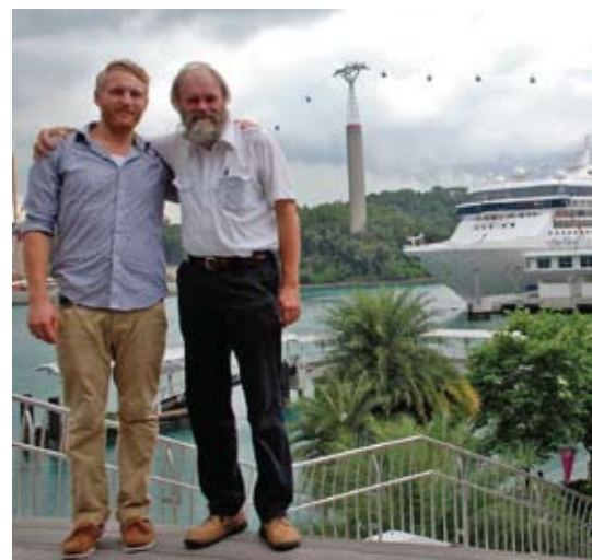
Till höger i bild ligger Superstar Virgo förtöjd.