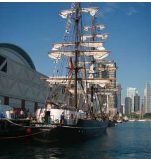
Roald Amundsen kom till slut fram till Lunenburg.

Bunkerfartyget Vilm har nu sett sina bästa dagar och blir 1989 upplagt i Neustadt, där hon fungerar som logementsfartyg. Normalt sett borde nästa steg ha varit upphuggning men nu inträffar något oerhört. I november